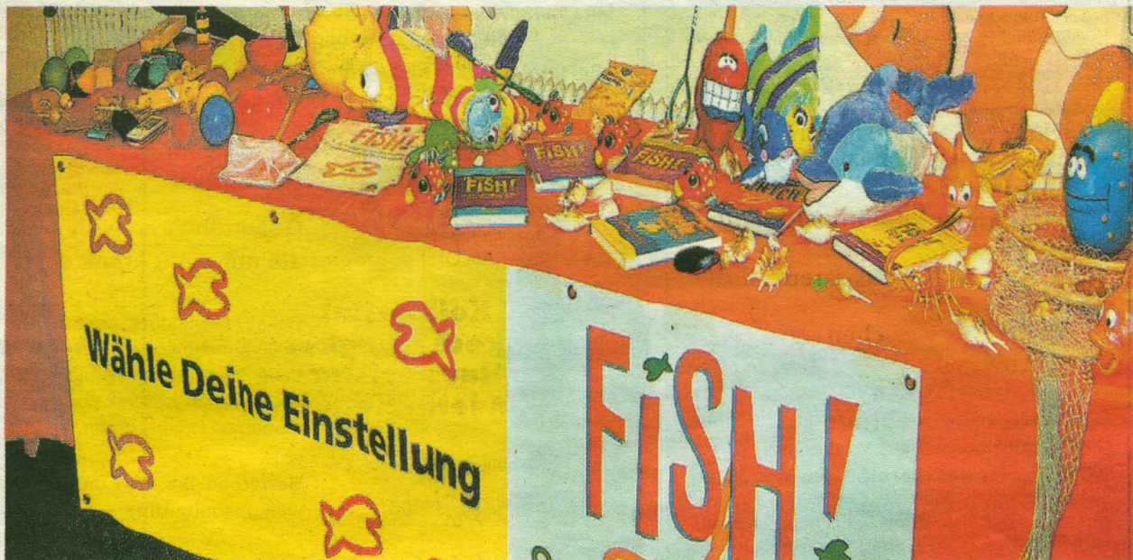
Das Fish-Prinzip hat sich in vielen Unternehmen in Change-Management-Prozessen bewährt und bringt auch – wie das Foto zeigt – für die Mitarbeiter Abwechslung zu den oft trockenen Seminaren.

Jeder kennt das Gefühl, wenn einem der Arbeitsalltag einholt – „Fish hilft uns dabei, herauszufinden, was unseren Spaß bei der Arbeit auslöst.“